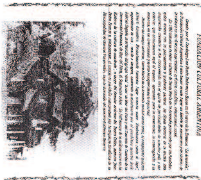
Frontal del programa del concierto del primer Campus Musical. Brevedad a cargo el 24 de febrero de 1991.