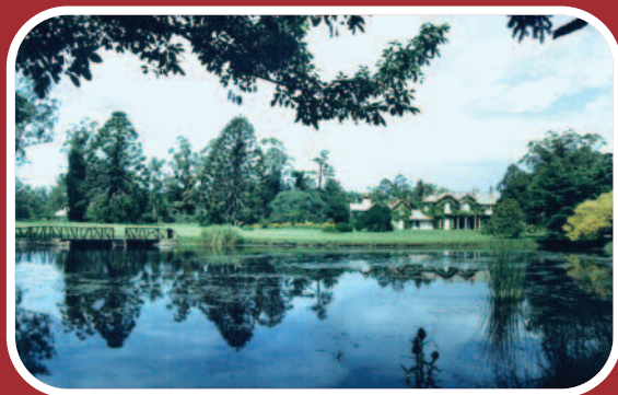
Fundación Cultural Argentina Campus "Santa María de la Armonía"

Navidad 2010 y el campus "Santa María de la Armonía" en su 20 aniversario